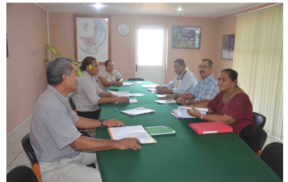
Groupe restreint de pilotage